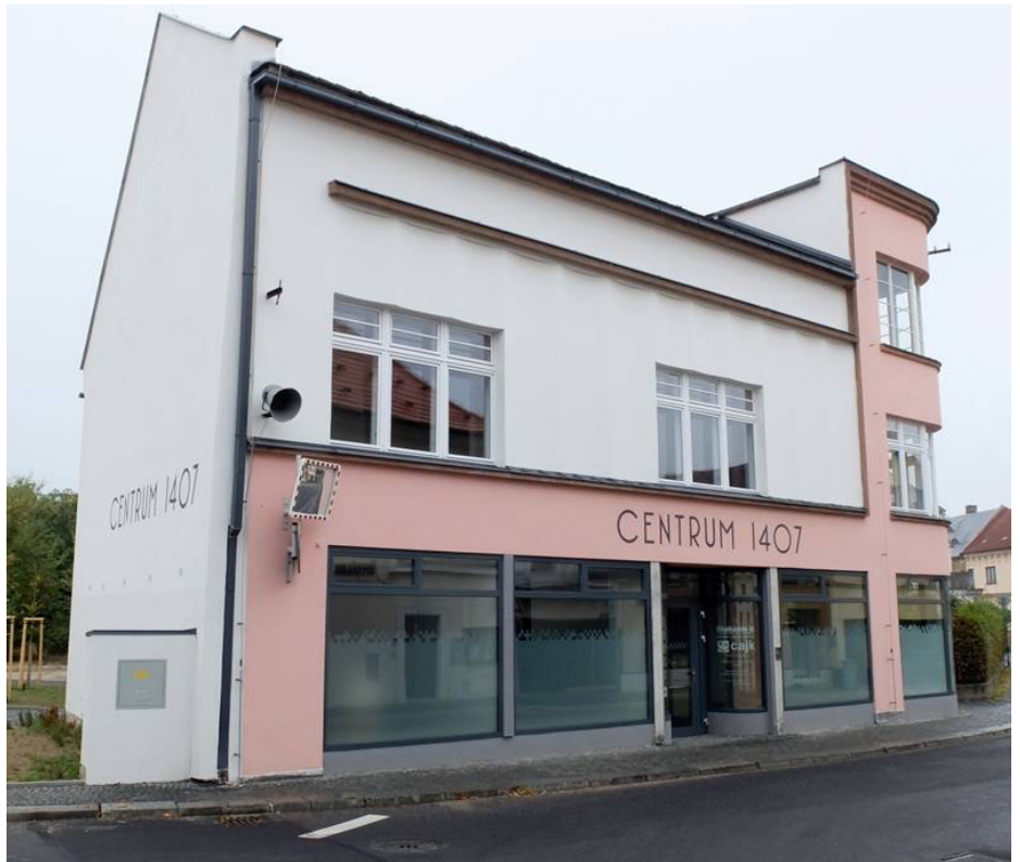
Pobočka centra ve Frýdlantu v ul. Míru 1407